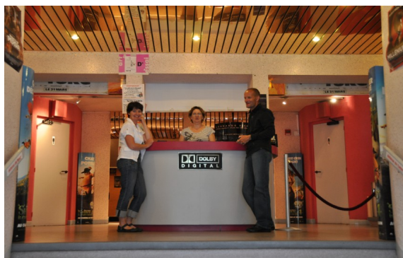
Soirée Concert de Blue 10/07/2010